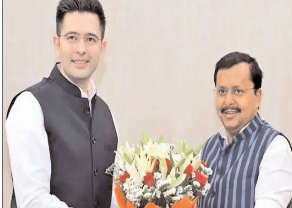
साफ कर दिया है कि पार्टी चुप बैठने वाली नहीं है और वह जल्द ही राज्यसभा के सभापति को पत्र

यह संख्या लगातार नीचे की तरफ लुढ़क रही है। इस बड़े सियासी उलटफेर के बाद आम आदमी पार्टी ने अपने बागी सांसदों के खिलाफ मोर्चा खोल दिया है। पार्टी के वरिष्ठ नेता संजय सिंह ने कड़ा पेंटराज जताते हुए आरोप लगाया है कि उनके 7 सांसद गैरकानूनी तरीके से बीजेपी में शामिल हुए हैं। संजय सिंह ने इसे सीधे तौर पर 'दल-बदल कानून' का उल्लंघन करार दिया है। उन्होंने स्पष्ट किया कि देश का कानून ऐसी किसी भी टूट को वैधानिक मान्यता नहीं देता है, इसलिए इस अवैधानिक कृत्य के खिलाफ सख्त से सख्त कार्रवाई होनी चाहिए। संजय सिंह ने